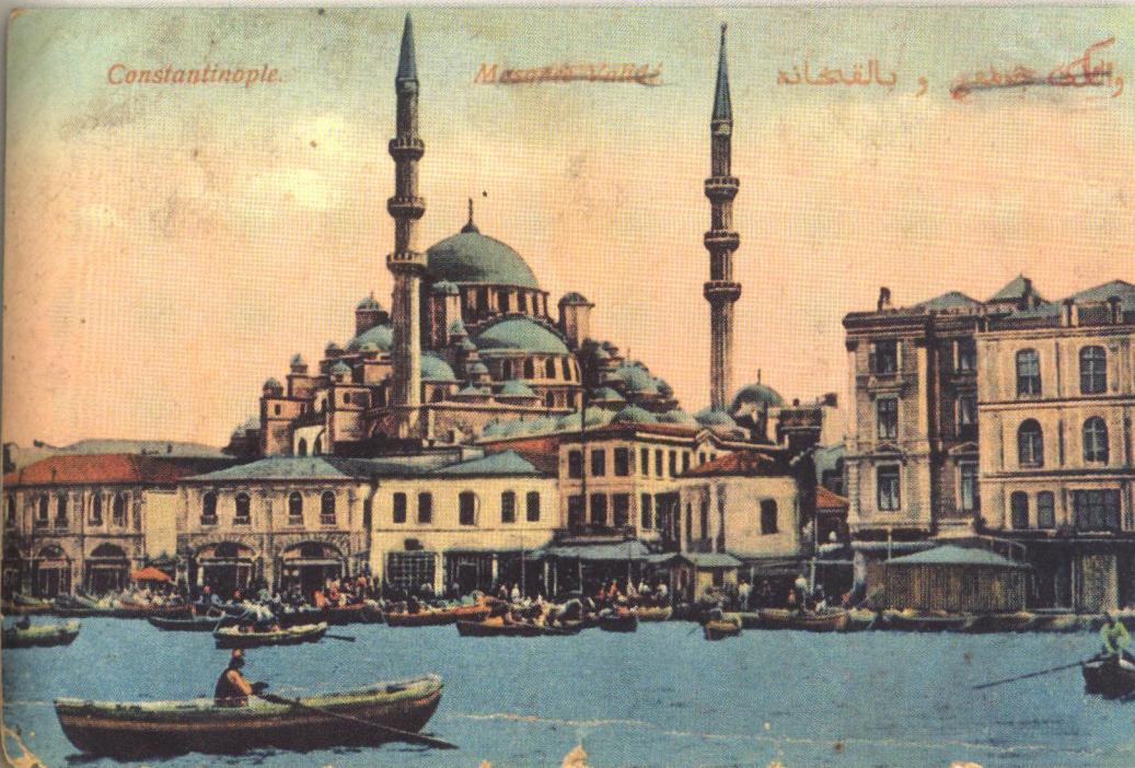
Valide Sultan Camii

M. Çağatay Uluçay; Padişahların Kadınları ve Kızları, Ankara 1980