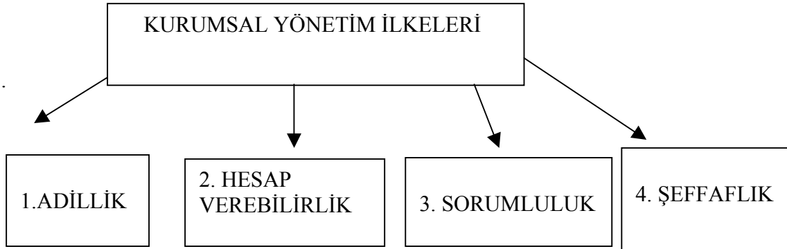
Şekil.1. 2.( OECD Kurumsal Yönetim İlkeleri).